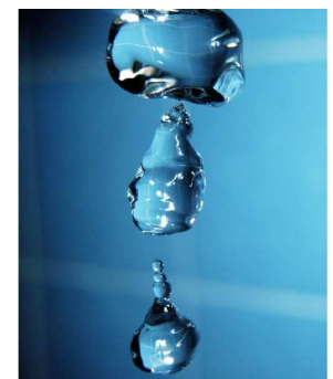
Gerade bei den Wassergebühren ist Auersbach weit über dem Durchschnitt zu finden