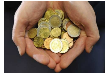
Bei den Gemeindeabgaben Müll, Kanal und Wasser liegt Auersbach bislang im Spitzenfeld der untersuchten Gemeinden.

meinden noch größer. In Auersbach leben Einpersonenhaushalte nach Ottendorf am teuersten. Je mehr Einwohner sich in einem Haushalt befinden, desto geringer ist der Pro-Kopf-Abgabenanteil gegenüber den anderen Gemeinden. Gänzlich außer Ansatz bleiben Gewerbebetriebe. Gibt es in anderen Gemeinden eine erhöhte Müllabfuhrgebühr für Gewerbebetriebe, so vermisst man diese in Auersbach gänzlich. Lediglich bei den Kanalabgaben wurde für Gaststätten eine eigene Regelung getroffen.