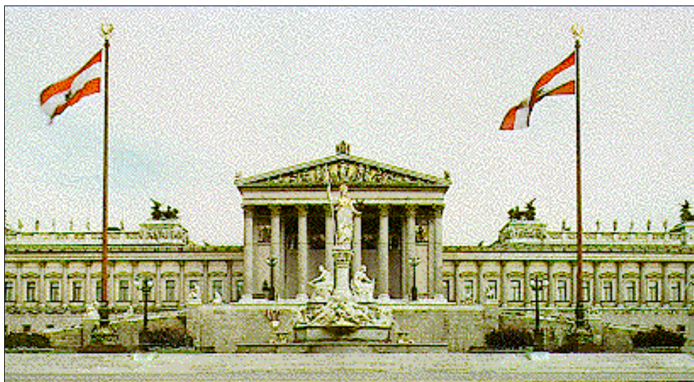
Das österreichische Parlament — Symbol der heimischen Politik