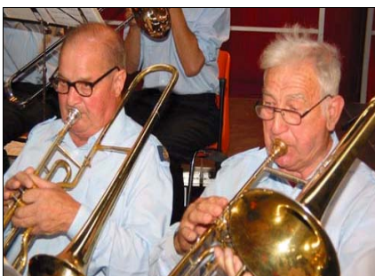
Neue Heimat für die Blasmusik

Oben angeführte Beiträge sind Einmalzahlungen der Gemeinde an die angeführten Organisationen und wurden bereits in einer Bürgermeisterkonferenz beschlossen.