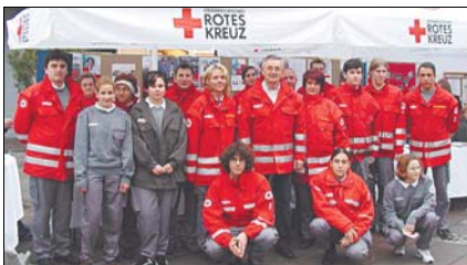
Neues Zentrum für das Rote Kreuz