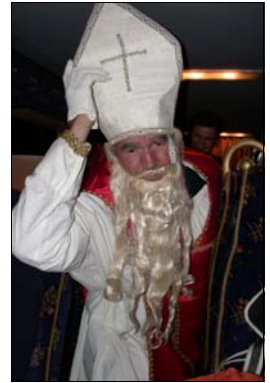
Als der Nikolaus kam ...