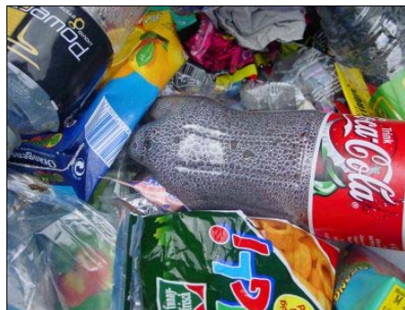
Plastikflaschen gehören in die gelbe Tonne und nicht in den Bach