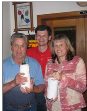
Welch Überraschung: Edl Reicht diesmal Platz 5