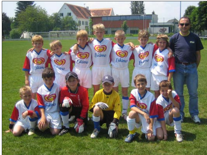
Die siegreiche Auersbacher U11: Burschen macht's so weiter!

was gleichzeitig den Endstand darstellte und den Meistertitel in der U11 Steiermark-Ost bedeutete.