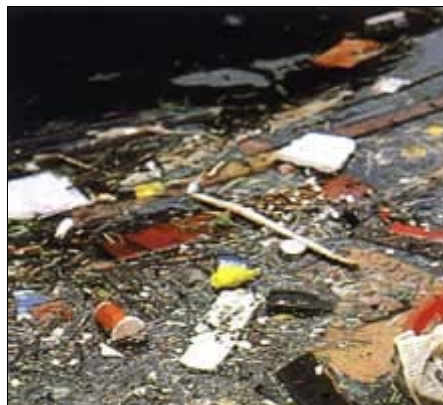
So manche „unschöne“ Überraschung fand man im Auersbach

Darum auch ein Appell an die Bevölkerung: Geben Sie den Müll in den Müllcontainer.