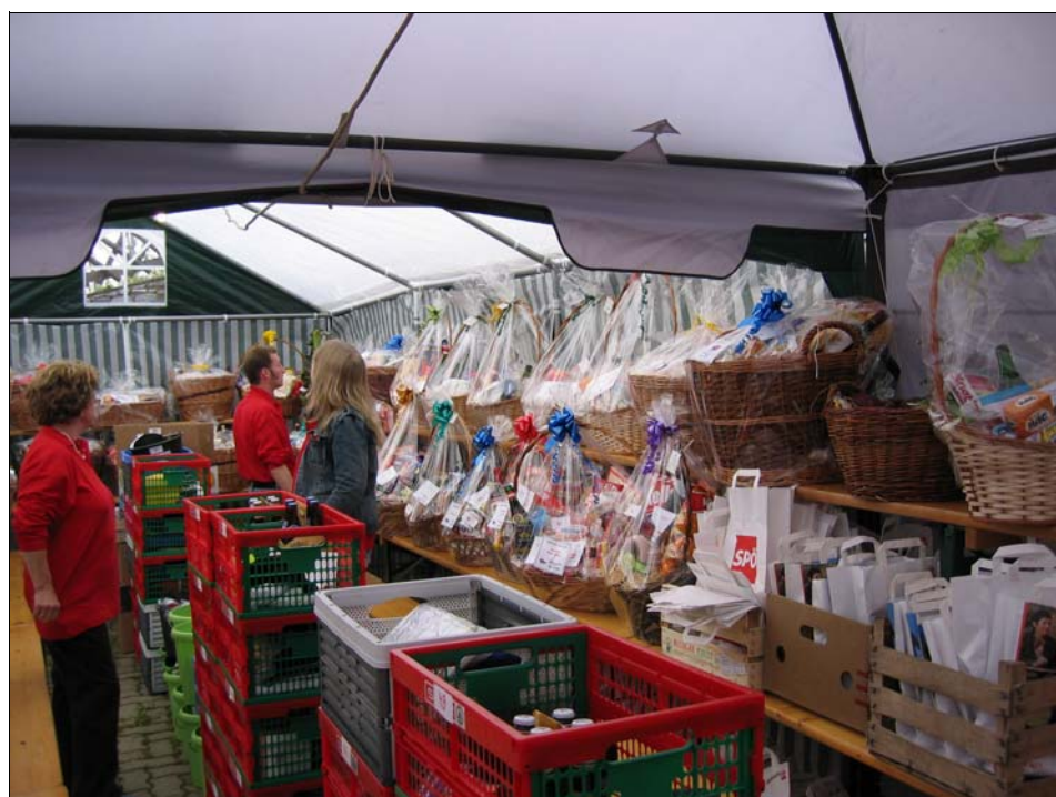
Das große Preiszelt. Da war für jeden etwas zu gewinnen. Ein Lob den Organisatoren.