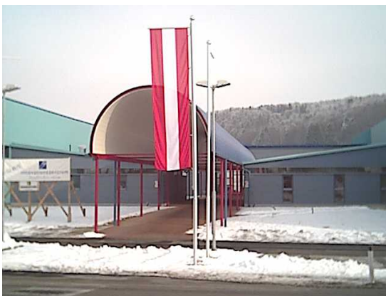
Warum beantwortet Bürgermeister Buchgraber Anfragen zum Innovationszentrum nicht?

dass es nie eine Auskunft zum Innovationszentrum an den Gemeinderat gegeben hätte. Somit sei er (Buchgraber) nun auch nicht bereit darüber zu berichten. Dazu ist festzuhalten, dass diese Aussage falsch ist. Schon Ober hat dem Gemeinderat Auskünfte über das Innovationszentrum erteilt. Stellt sich die Frage: warum verweigert Bürgermeister Buchgraber die Aussage? Gibt es andere Gründe warum er die Anfragen der SPÖ nicht beantwortet?