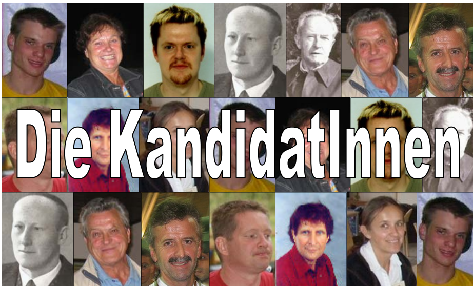
Zehn KandidatInnen stellen sich der Wahl!

Wahl zur/m Auersbacher/in des Jahres 2008!